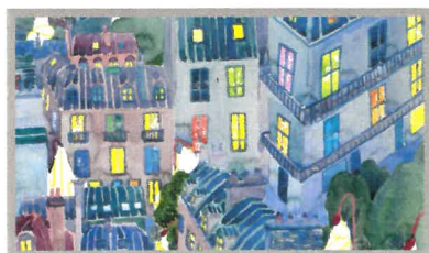
« Vies à vies II » Alice SARRAUSTE - 2020

Les candidats EMCA 1ère année ou 2ème année passent un concours commun comportant deux épreuves (en distanciel) : Epreuves d'admissibilité - Storyboard : du 06 au 10 avril 2021 Epreuves d'admission- Oral : du 17 au 20 mai 2021