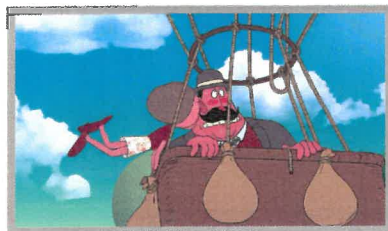
« Gonflé » Louis CHANGEUR - 2020