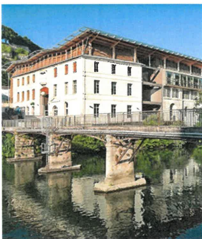
Bâtiment Le Nil : Amphithéâtre, Resto' U, Foyer étudiant

A la fin du premier cycle Bachelor of Arts en Cinéma d'Animation, les étudiants réalisent seul ou en équipe un court-métrage d'animation d'environ 3 minutes. Ce projet est encadré par des réalisateurs ou des auteurs et la technique de production du film est laissée à l'appréciation de chaque étudiant parmi les techniques enseignées.