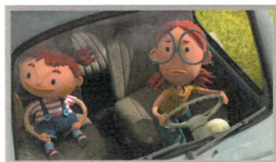
« On va ramener Bernie chez Papi » Arielle BESSE/Shiuan-An LI/Lilimirana RAKOTOSON - 2020

EMCA - Dossier d'Inscription Château Dampierre 1 rue de la Charente 16000 ANGOULEME