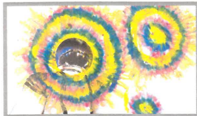
« 1000 rêves : Zenti l'invincible » Jonathan PHANHSAI-CHAMSON - 2019

EMCA - Dossier d'Inscription Château Dampierre 1 rue de la Charente 16000 ANGOULEME